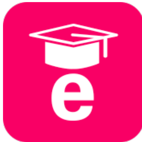
Logo della piattaforma eDucation

♥ A partire da qui, l'intento è di rafforzare progressivamente la componente di e-learning, ovvero la quota di formazione erogata attraverso canali digitali. Una volta dotatisi di una piattaforma all'avanguardia e averla portata in giro per il mondo, rendendola il singolo punto di accesso al sapere, saper fare e saper essere per tutti i 70 mila colleghi, il passo successivo è sfruttare le infinite potenzialità offerte dal Web per erogare